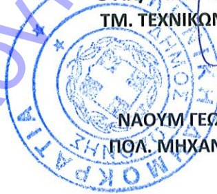
ΝΑΟΥΜ ΓΕΩΡΓΙΟΣ ΠΟΛ. ΜΗΧΑΝΙΚΟΣ Τ.Ε.

ΘΕΩΡΗΘΗΚΕ Αγία Κυριακή Ιανουάριος 2020 Ο ΑΝ/ΤΗΣ ΠΡΟΙΣΤΑΜΕΝΟΣ ΤΜ. ΤΕΧΝΙΚΩΝ ΥΠΗΡΕΣΙΩΝ